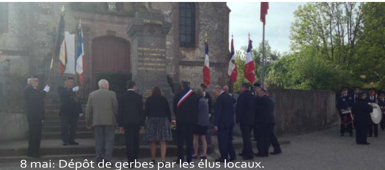
8 mai: Dépôt de gerbes par les élus locaux.

C'est en présence de nombreux élus locaux, des membres des différentes sections d'anciens combattants du secteur mais aussi de nombreux cruciminoises et cruciminois que les cérémonies du 8 mai et du 11 novembre 2015 se sont déroulées au monument aux morts. Ces cérémonies étaient également rehaussées par la présence des sapeurs pompiers de centre d'intervention des quatre communes, de l'harmonie municipale de Ban de Laveline et de la chorale du Val de Galilée.