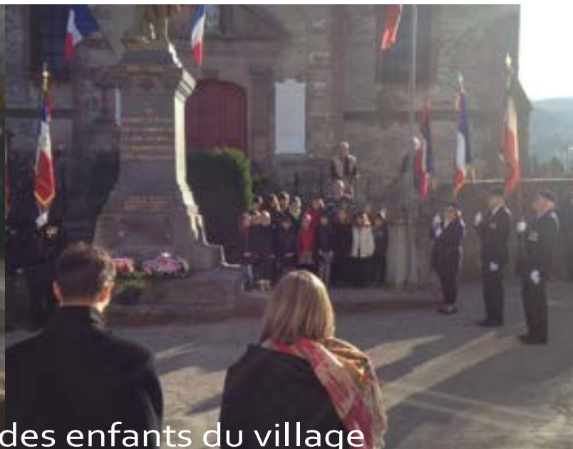
11 novembre: participation des enfants du village