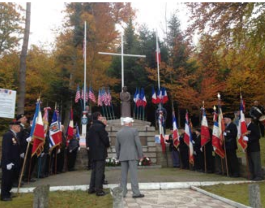
Présence du porte drapeaux et des membres de la section unc-afn de La Croix-aux-Mines à la cérémonie de la libération de la vallée de Fraize-Plainfaing au col de Mandray.