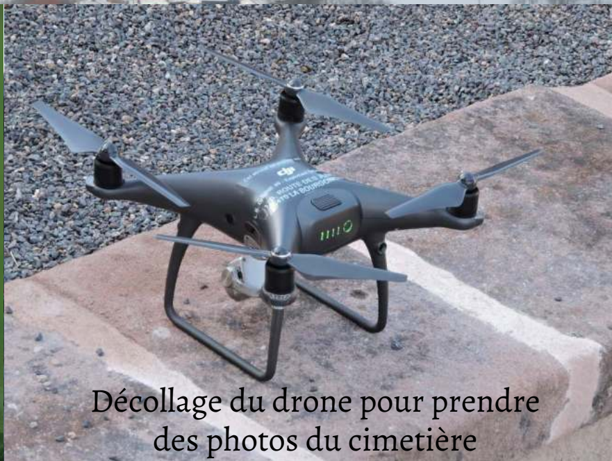
Décollage du drone pour prendre des photos du cimetière

Le conseil municipal a décidé de lancer un diagnostic de revalorisation végétale du cimetière pour ne plus être obligé de le désherber mais aussi pour le fleurir et l'harmoniser avec la nature