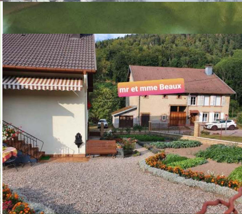
mr et mme Beaux