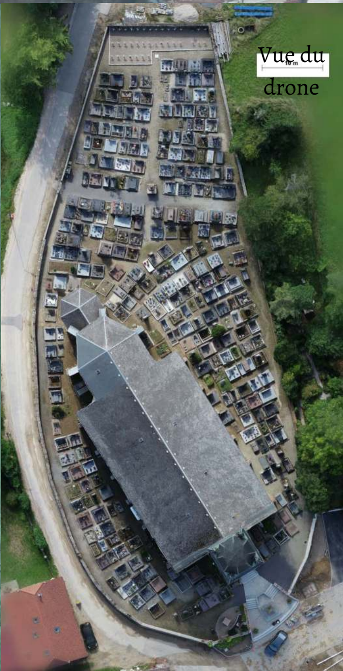
Vue du drone