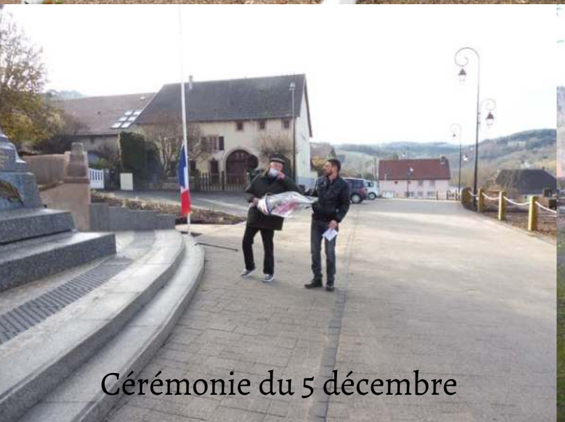
Cérémonie du 5 décembre